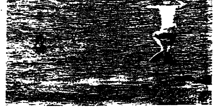
من المناطق الصحراوية - وتوقع مرصد بيروت ان تنتهي هذه الموجة في غضون يومين على الاكثر